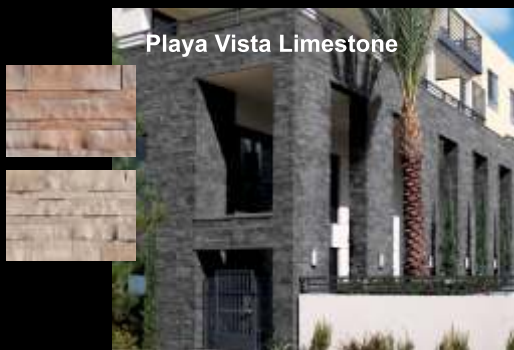
Playa Vista Limestone